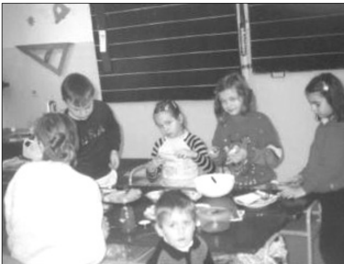
Príprava pohostenia 2. triedy.