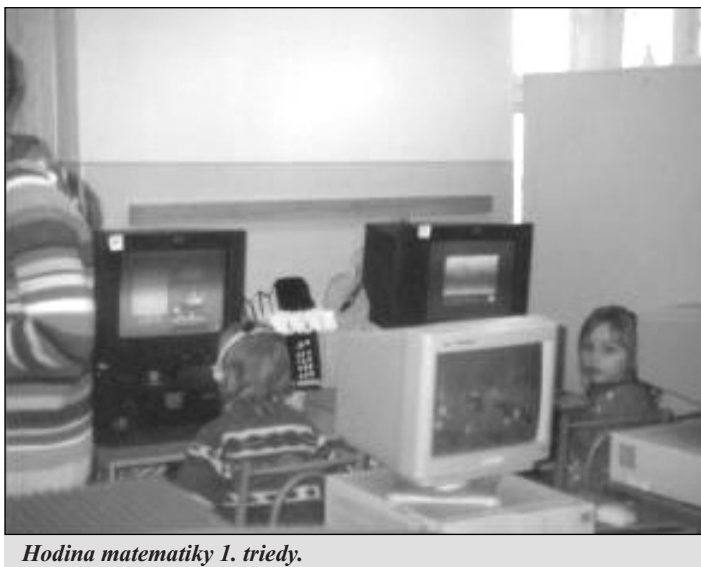
Hodina matematiky 1. triedy.

V rámci zdravého dňa pripravili žiaci v spolupráci s rodičmi a pani učiteľkami zdravé nátierky, ktoré mohli hostia ochutnať na vianočnom posedení. V tomto školskom roku čaká našich žiakov ešte veľa