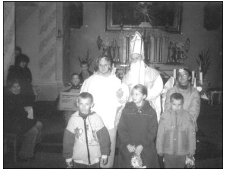
Aj do Lukáčoviec zavítal svätý Mikuláš...