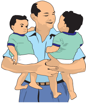
Zdravie je základom spokojnosti v rodine. Ilustračný obrázok

Naše staré mamy si pri chorobách pomáhali liečivými bylinkami, odvarmi z nich, poznali i rôzne triky, ktoré často zabrali. Ak tiež nechcete hneď siahať po liekoch, ponúkame Vám zopár rád, ako si môžete pri niektorých ťažkostiach pomôcť.