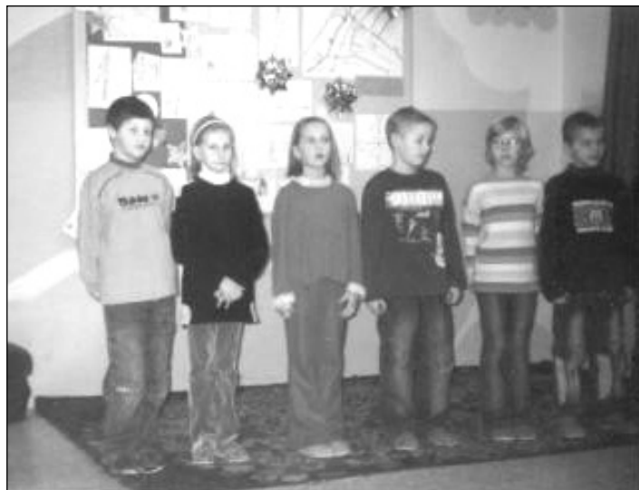
Kultúrny program 3. triedy.